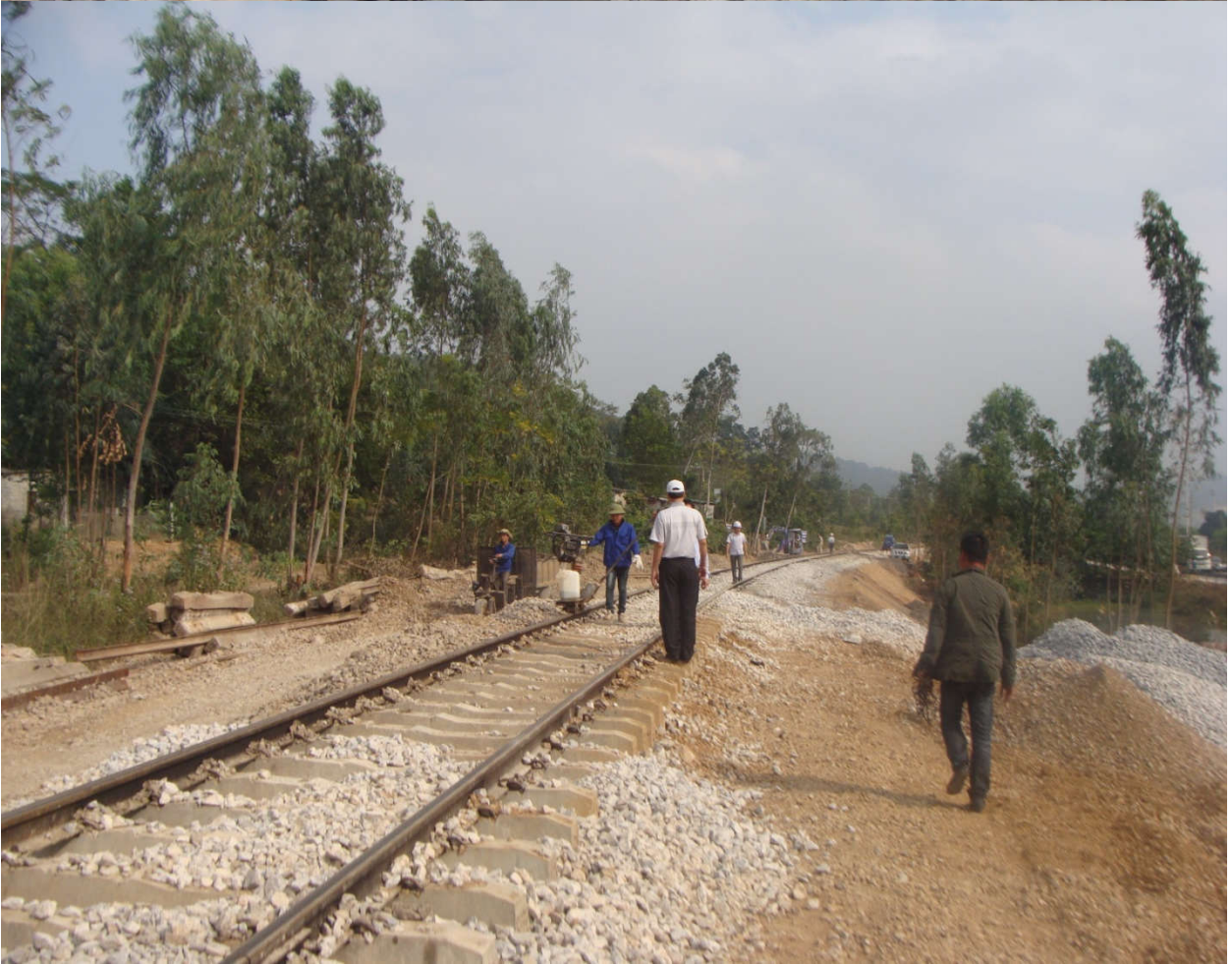
* Thi công công trình đường sắt vào mỏ than Quảng Ninh 2016: