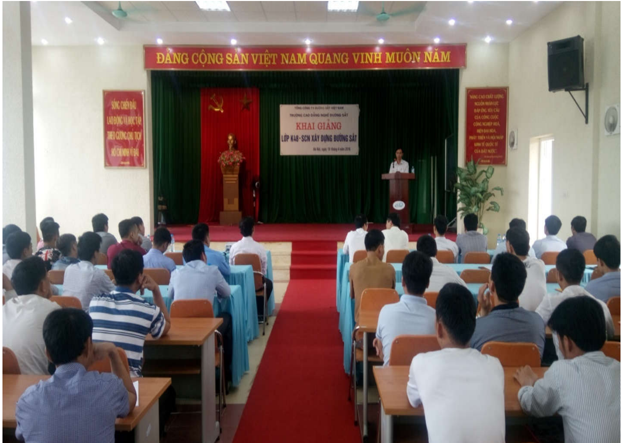
* Tập huấn công tác Quân sự tự vệ tại Công ty năm 2016: